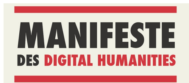
Figure 1: Example for a column-width figure

Morbi fermentum mauris sit amet euismod accumsan. Donec gravida sapien erat. Mauris eu arcu ac leo sodales tincidunt non et turpis. Donec non erat feugiat, convallis enim nec, interdum nisi. Suspendisse facilisis luctus velit, eu facilisis arcu. Proin pellentesque tellus venenatis, ultrices massa vel, malesuada risus. Sed nec est ut tortor